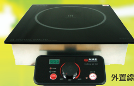
外置線制旋鈕開關設計